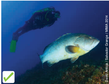
David Antoja / Salvador Grange / MIMA 2014

La diversidad de las poblaciones de peces es uno de los principales valores del fondo marino del Parque. Una buena observación es posible sin necesidad de ofrecerles alimento.